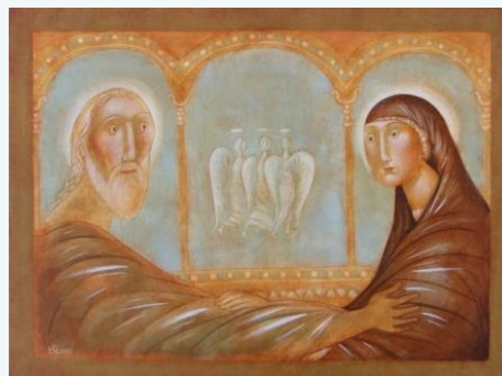
De drie engelen op bezoek bij Abraham en Sara – verbeelding van de Triniteit – Julia Stankova

De icoon die jij ziet bepaalt jou bij de icoon die jij zelf bent.