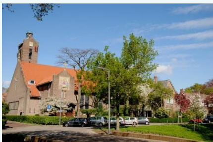
Een prachtige mozaïek siert nu het kerkgebouw van de Servisch Orthodoxe parochie in Rotterdam

De aartspriester van de Servisch Orthodoxe parochie leerde mij: probeer niet alles te begrijpen met je